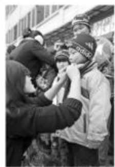
镇海中学首届模拟招聘会上，学生们正在投递简历。

“招聘会”现场，穿着中学校服的学生穿梭于各个“招聘展位”之间，有些“随处逛逛”，有些则手持“求职简历”四处探寻，找到感兴趣的“职业”，立即整理好着装，面带微笑，大大方方走上前递上“简历”。 招聘展位、学生递“简历”、面试、“考官”打分……经过层层筛选，择优“录取”。整个流程与真正的招聘会相同，不仅如此，校方还请了人才公司的专业人士在现场为学生进行指导。 “重点高中的学生有必要提前那么多年参加模拟招聘会吗？”校方表示，这次活动是高一学生自己组织的，除了让学生提前接触社会，也希望通过招聘会，让学生有比较明确的职业规划。