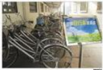
象山老板花30万元 请69名员工去北京旅游

这几天,宁波镇海中学自行车棚里多了几辆“崭新”的自行车,旁边还有一块牌子“自行车使用卡”。据负责自行车的老师告诉记者,只要在报上登出决定下自行车的报纸,就可以使用。