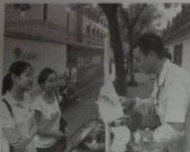
镇海中学代表走进多家菜场,采访小摊贩