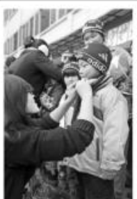
镇海中学模拟招聘会上，学生正在与用人单位交流。