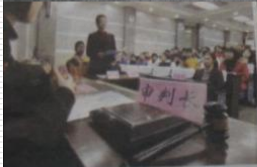
镇海中学模拟法庭开庭

据美国食品消费者网站(foodon-matters.org)近日报道,食用油炸物可能增加中风的风险,该疾病在美国每年夺去约13.4万人的生命。